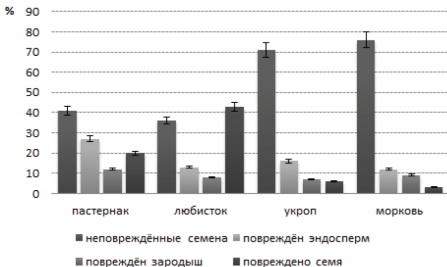
Рис. 2. Доля семян овощных зонтичных культур (контроль), имеющих повреждение зародыша и (или) эндосперма (ФГБНУ ВНИИО, 2011—2013 гг.)

На разрезе дефектных семян, как правило, отчетливо виден поврежденный зародыш или его полное отсутствие. В зависимости от года исследований беззародышевость варьирует у различных изучаемых культур (рис. 2). Так, у моркови беззародышевость семян изменялась от 9 до 11%, у укропа — от 5 до 9%, у любистока лекарственного — от 2 до 12%, а у пастернака достигала 15%.