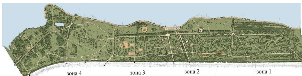
Рис. 2. Зоны парка «Северное Тушино»:

Кроме того, предусмотрено устройство нескольких второстепенных входов — в зону тихого отдыха, в физкультурно-оздоровительную зону, в прогулочную зону в северной части парка. Часть входов запроектированы с возможностью въезда и выезда автомобилей, обслуживающих территорию парка.